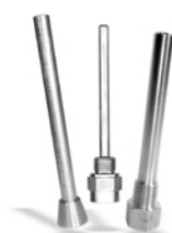
Doigts de gant Voir rubrique "Accessoires divers"

Exemple de référence pour une sonde avec une gaine de protection de 50 mm, Ø 6 mm en 1 x Pt 100 : BOSI501-6