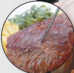
Contrôle rapide de la température à coeur à l'aide de pointe de mesure fine et robuste