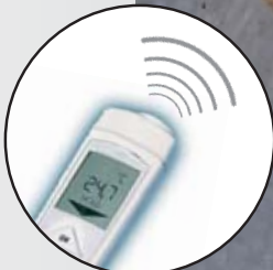
testo 106-T2 avec alarme acoustique lors des dépassements de valeurs limites inférieures et supérieures