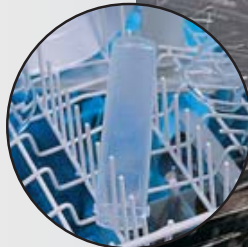
Étanche avec l'étui de protection TopSafe, lavable au lave-vaisselle