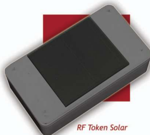
RF Token Solar

Grâce à ces trois caractéristiques majeures ( alimentation autonome, stockage embarqué et télérelevé ), le RF Token Solar est parfaitement autonome et facile d'utilisation : il peut être fixé n'importe où et ensuite être entièrement piloté à distance.