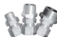
Raccords coulissants acier pour thermocouple