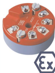
Transmetteur programmable à entrée universelle avec protocole HART