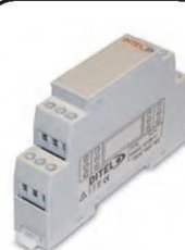
Convertisseur programmable USB : Entrées PT100 Sortie: 0/4 - 20 mA