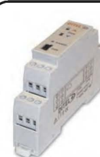
Convertisseur programmable USB : Entrées PT100, mA, mV TC: E,J,K,N,R,S,T Sortie: 0/4 - 20 mA