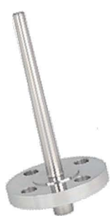
Doigt de gant inox, à bride, mécanosoudé